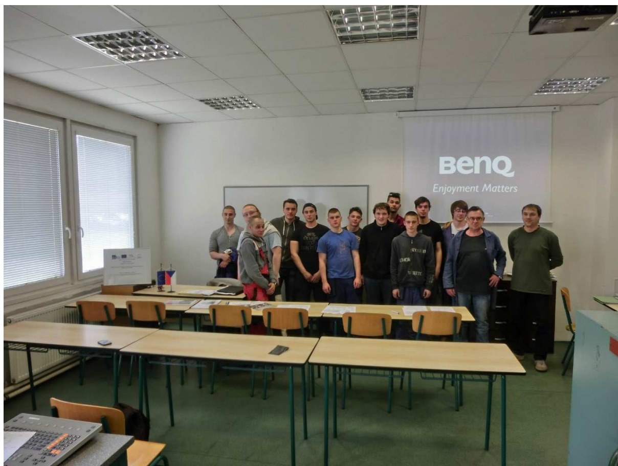
Na foto – žáci skupina 2, učitelé SOŠ a SOU

Škola: Střední odborná škola a Střední odborné učiliště, Kuřim