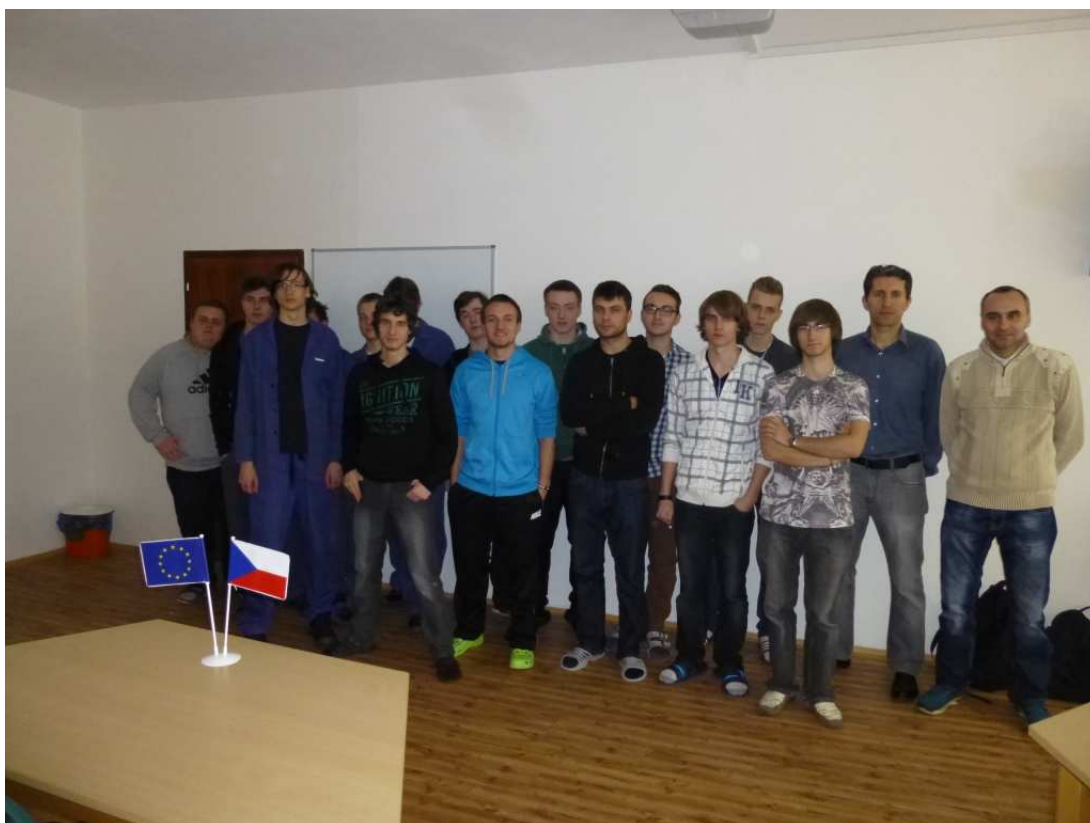
Na foto – žáci skupina 1 a lektori

Škola: Střední škola stavební a technická, Ústí nad Labem